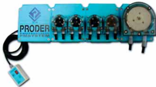
PROMATIC BASIC 04-948