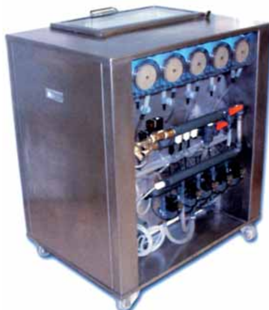
PROMATIC TOP EVOLUTION